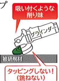
使い切り研削量 比較データ (当社比)

新製品というだけ今までの 砥石より性能が良いのは当 たり前としても、その高性能 に反したコストパフォーマン スも実現しています。